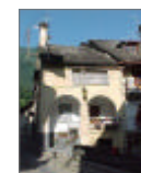
TAVOLA 16 PROGETTO